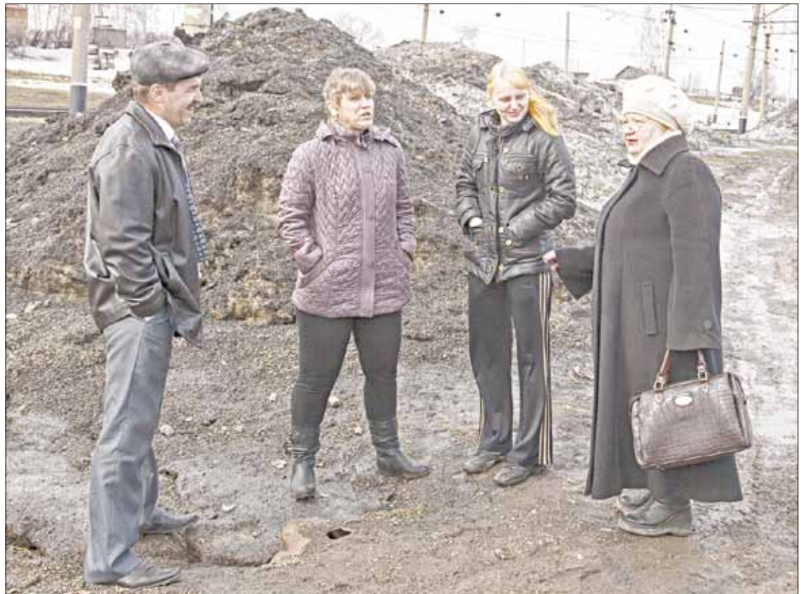
■ Активисты Забойщика знают, к кому обращаться со своими насущными проблемами.

Вскоре появилась и детская площадка. Силами работников БКС были изготовлены качели, мини-спортивный комплекс. Открывали эту площадку дружно и весело всем поселком. Ее украсили воздушными шарами, для ребятни приготовили веселую развлекательную программу, подарки и конфеты. По свидетельству старожилов поселка, такого дружного праздника на улицах Забойщика не было никогда. У ребятни постарше с недавних пор тоже есть