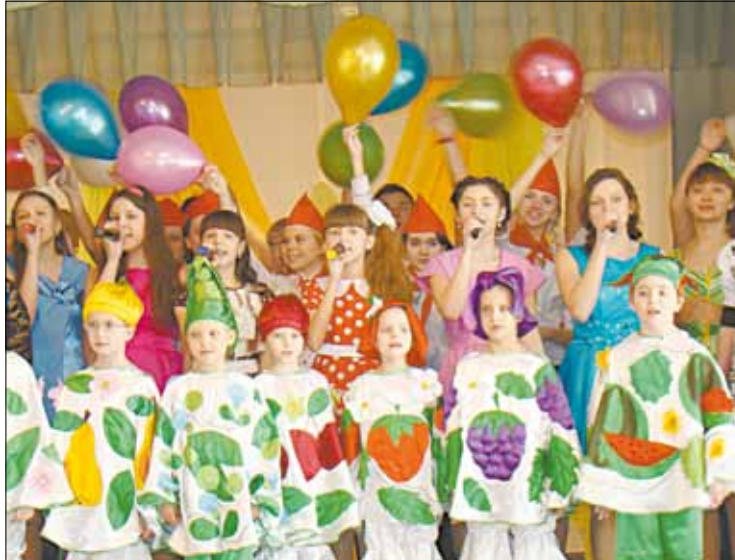
■ Закончили юные артисты свое выступление песней о родном Центре и салютом из конфетти.

О первых годах работы Дома пионеров поведала коллегам один из его прежних ру-