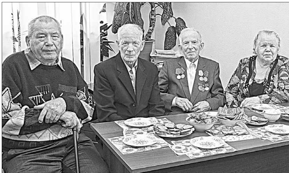
■ Сегодня в Берёзовском проживает четырнадцать бывших малолетних узников. К сожалению, на встречу смогли прийти не все.

Сейчас пожилые люди готовятся к участию в музыкальном и танцевальном этапах конкурса. Лучшие номера войдут в программу гала-концерта.