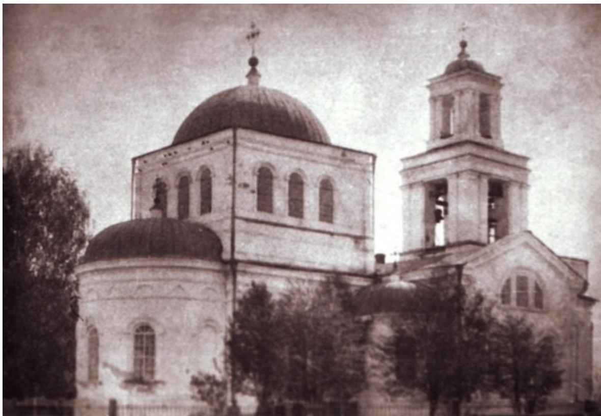
Церковь села Заводо-Успенского, начало 20 века

Не оторвать взгляда от вида церкви села Заводо-Успенского, к глубокому сожалению, сохранившейся только на фотографиях.